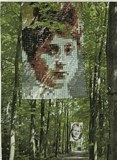
Voormoeders, kunstproject van Meg Merx. Aangeleverde foto