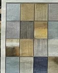
Kleurencompositie groene aarde, van Charlotte Caspers.

Wie gewillig zich op het visskerkhof en verder daar vandaan laat meeveren door de wind kan eindeloos dwalen en verdwalen langs de Reest. Andere activiteiten zijn een foto-project, speciale opdrachten voor kinderen, een borduurproject, een zandkleurenproject en meetings met kunstenaars Grensloos