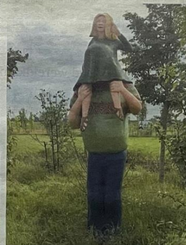
Kiekeboe van Paul de Reus. Aangeleverde foto