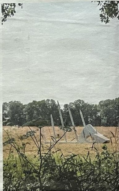
'Blowing in the wind', een interactief kunstwerk van Rob Verwer en M.

New Yorkse bomen Hoewel buitenbeelden nog steeds het handelsmerk bij uitstek zijn van Grensloos Kunst Verkennen, maken ook de binnen-exposities op bijzondere locaties al langer deel uit van het totaalpakket. Zo blijkt de relatie tussen kunst en kerk al jarenlang een sterke formule. Het interieur van de kerk in Ijhorst en de daar geëxposeerde kunstwerken garanderen stevast een bijzondere synergie. Moeizamer is de relatie tussen kunst en het interieur van de Reesthof. Maar dat gaat dit jaar veranderen, verzekert Anouk